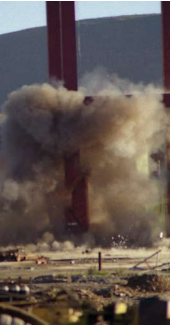
Aplicación de nuevas técnicas: utilización de explosivo de uso militar para la demolición de una torre de minería de 60 Tm. Mina de Rubiales. Lugo.