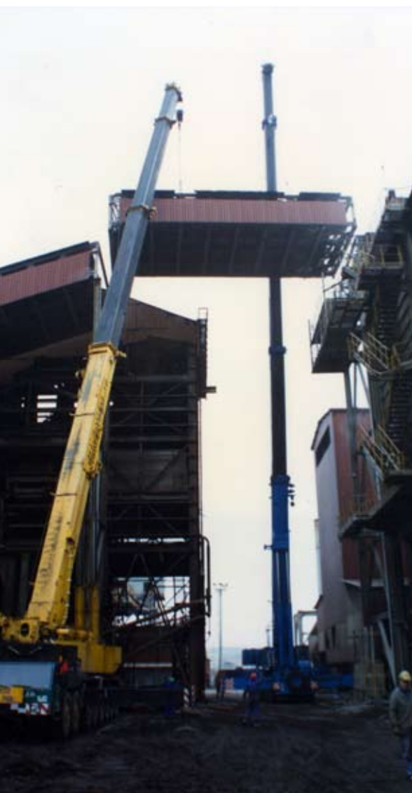
Desmantelamiento del edificio de sinterizado G2 de Altos Hornos de Vizcaya